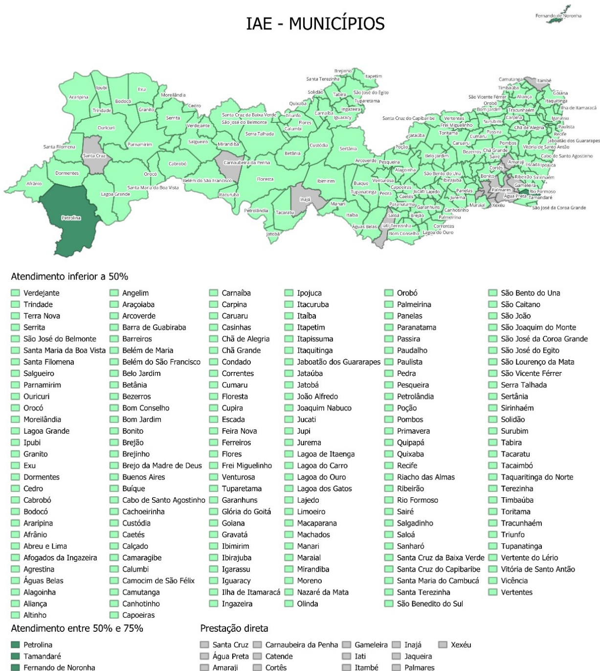
Figura 2 - Informações do IAE dos municípios inseridos no mapa de Pernambuco.

A Tabela 4 evidencia também a grande diferença dos indicadores de atendimento entre as áreas urbanas e rurais (IAA e IAE), principalmente em decorrência da não disposição de informações para os indicadores da área rural. Em relação aos indicadores de cobertura (ICA e ICE) os mesmos são maiores que os de atendimento por considerarem, em sua definição, a disponibilidade do serviço por rede pública ou solução alternativa de abastecimento de água e/ou esgotamento sanitário, e não a efetiva conexão à rede pública.