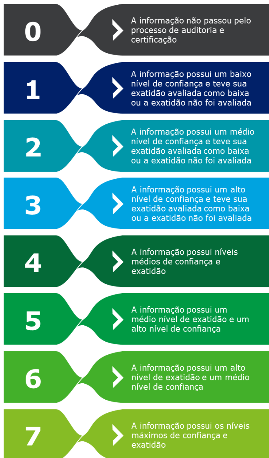
Figura 3 - Descrição das Certificações Atribuíveis às Informações do SNIS.

Entende-se que, caso uma informação seja avaliada com o nível de confiança mínimo, esta não deve ter a sua exatidão avaliada, já que os controles internos não são capazes de gerar dados confiáveis para a