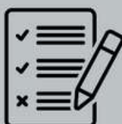
Relatório e TN